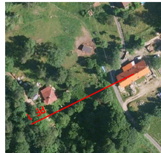
B.3.S0 05.4 Údolnicový profil navrhovaným opatře S0 05c