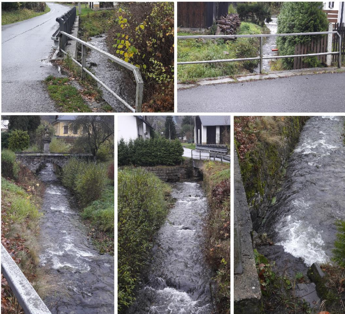
obr. 1 - Fotodokumentace ohroženého místa 0010 - soutoku Vlčího potoka + Rokytky, mostní objekt křižující silnici II. třídy č. 592

Lokalita byla v rámci analytické části definována jako ohrožené místo a evidovaná pod identifikátorem ohroženého místa 0010 .