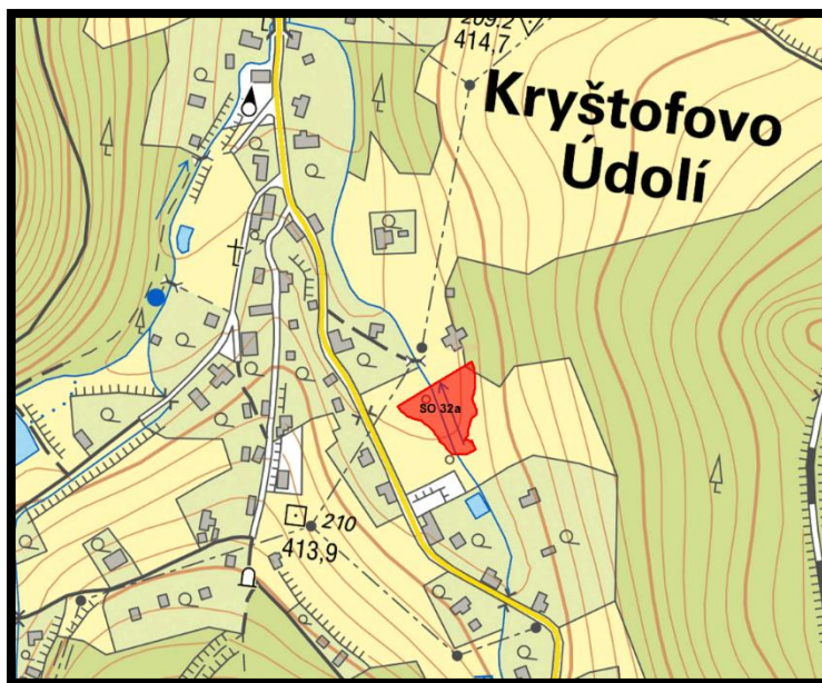
obr. 2 - Přehledná situace opatření