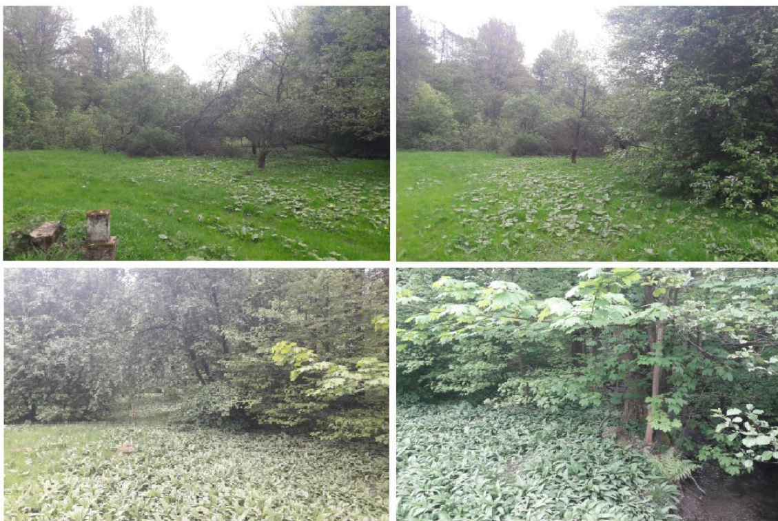
obr. 2 - Fotodokumentace vytipovaného místa pro navrhované opatření

V rámci řešené lokality je navrženo jedno opatření.