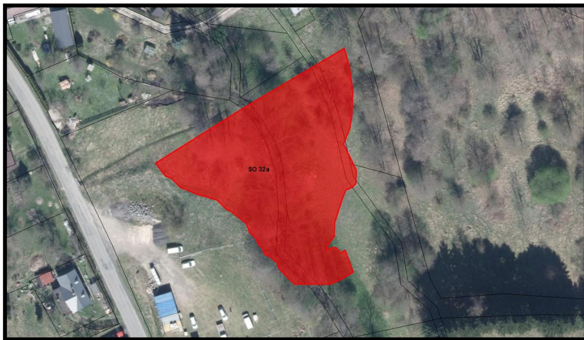
obr. 4 – Detail umístění vodní nádrže

Navrhuje se nová výstavba vodní nádrže umístěnou na vodním toku Rokytka. V současné době se jedná o nevyužívaný pozemek.