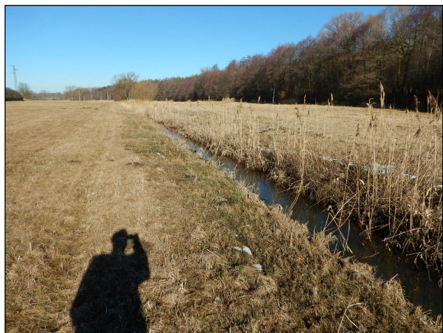
Obr.1: Technicky upravený úsek toku bez břehových porostů vhodný pro revitalizaci