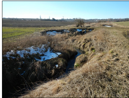
Obr.2: Pohled na úsek toku pod cestním propustkem (v místě navrhované nové ČOV na LB)—silné zahloubení a výrazná boční eroze koryta