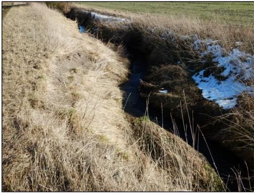
Obr.1: Profil erodovaného koryta Strašeckého potoka v úseku pod navrhovanou ČOV